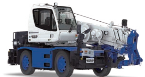
CREVO mini G4(GR-130NL/N)

最小クラスのラフテレーンクレーンでありながら、従来の2ウインチから、16tクラスに搭載のパワフルな1ウインチに集約し、フック1本掛け時の定格総荷重が3.2tという、クラス最大性能を実現しました。さらに最大作業半径は、ブーム:22.5m、ジブ:25.9mと拡大し、共にクラス最大を誇ります。