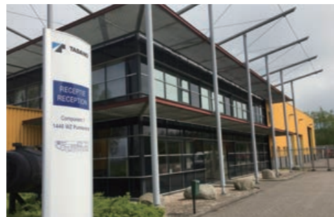
タダノ・ネーデルランド B.V.(オランダ)

当社グループは長期目標として「LE世界No.1」を掲げており、海外事業の拡充・シェアアップに取り組んでいます。本買収によりヨーロッパでの更なる拡販・シェアアップを目指します。