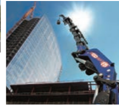
折り曲げブーム式クレーン