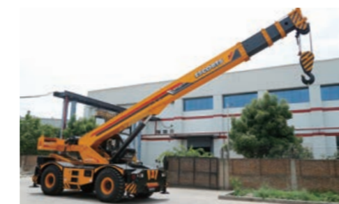
Escorts社の製品(ラフテレーンクレーン)

成長が著しいインド市場で、さらなる事業の拡大と当社グループの成長を図るべく、農業機械や建設機械を製造する現地の有力メーカーであるEscorts Ltd.(エスコーツ社)との間で2018年8月、合併会社の設立に合意しました。資本金は6億インドルピー(出資比率:タダノ51%、Escorts社49%)で、当社製クレーンの販売拡大のみならず、現地での設計・ものづくりによる競争力強化を目指します。